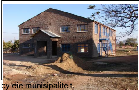
by die munisipaliteit.